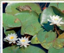
Le nénuphar blanc, qui avait disparu du Valais, a été réintroduit dans divers plans d'eau, dont le lac de Montorge.

Le lac, qui gèle complètement chaque hiver, s'est formé après le retrait des glaciers il y a environ 17'000 ans. Le plan d'eau et les milieux humides qui le bordent offrent refuge à de nombreuses espèces aquatiques et palustres: oiseaux, batraciens, poissons, libellules, mollusques... Les crapauds communs viennent chaque printemps par dizaines pour y pondre leurs œufs. Le lac et ses berges font d'ailleurs partie de l'Inventaire fédéral des sites de reproduction de batraciens d'importance nationale.