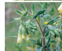
Une plante rare typique du Valais central: l'onosma.

Le flanc nord, plus ombragé et plus frais, est essentiellement recouvert de forêts. Si le chêne domine encore dans la partie sommitale, le pin sylvestre prend le relais dans la partie intermédiaire pour être lui-même remplacé par le tilleul, plus bas près du lac.