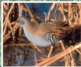
Le plus souvent caché dans les roseaux, le râle d'eau mène une vie discrète.