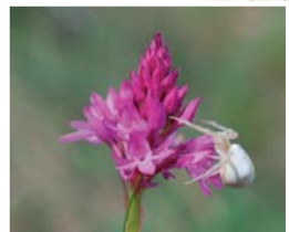
Orchis pyramidal et araignée-crabe