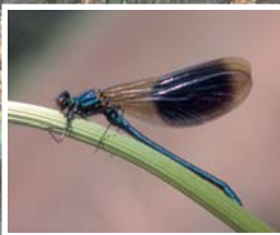
Le lac de Montorge est l'un des sites les plus riches du Valais pour les libellules. Ici le caloptéryx éclatant.