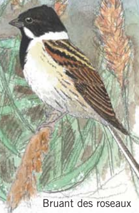
Bruant des roseaux