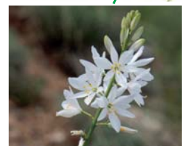
Anthéricum à fleurs de lis